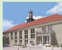
Audimax (Gebäude 11)